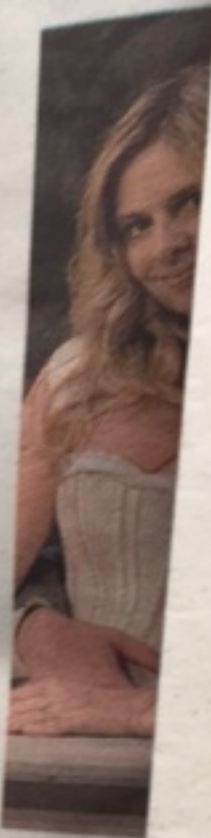
di DIEGO V

grado di dialogare con le centrali operative del Comune e di Atm