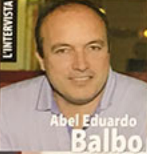
Abel Eduardo Balbo