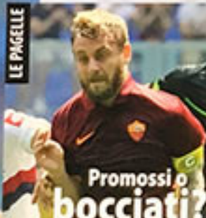
Promossi o bocciati?